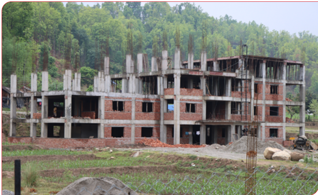
राक्सिराङ्ग गाउँ कार्यपालिकाको कार्यालयको निर्माणाधीन भवन