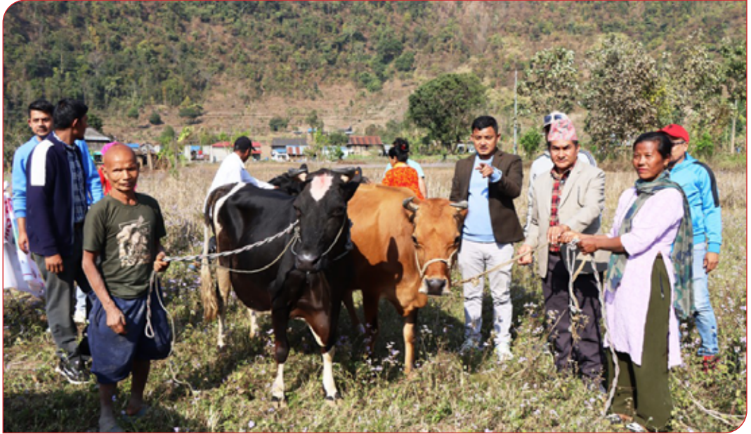
उन्नत जातको जर्सि गाई वितरण कार्यक्रम