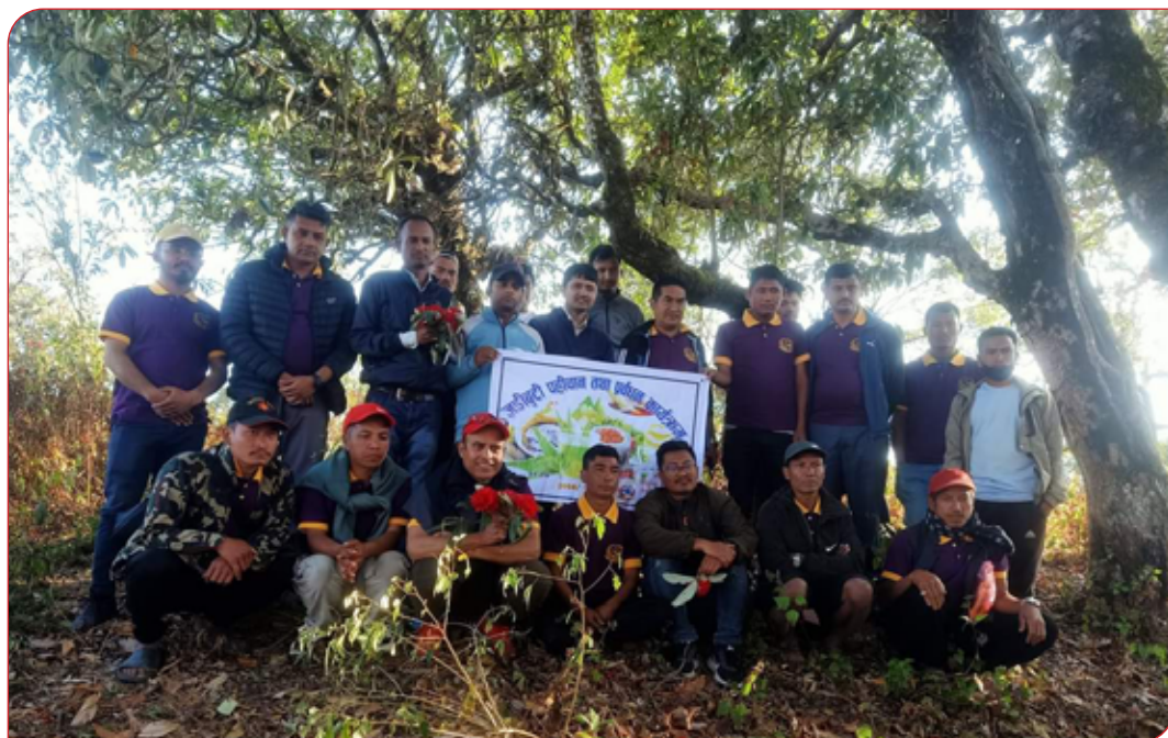
जडिबुटी पहिचान तथा पर्वधन कार्यक्रम