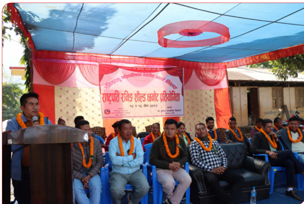
राष्ट्रपति रनिङ्ग सिल कार्यक्रम