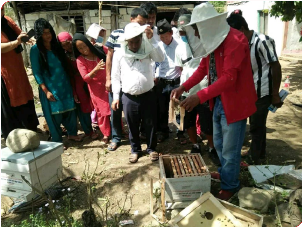
मौरी पालन तालिम