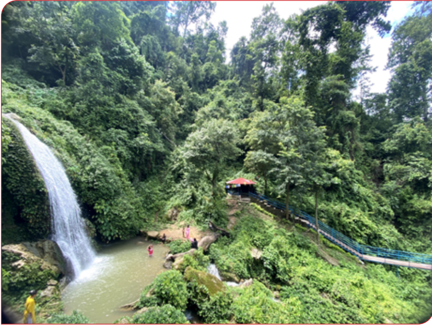
जलपरी भरना, राक्सिराङ्ग ३