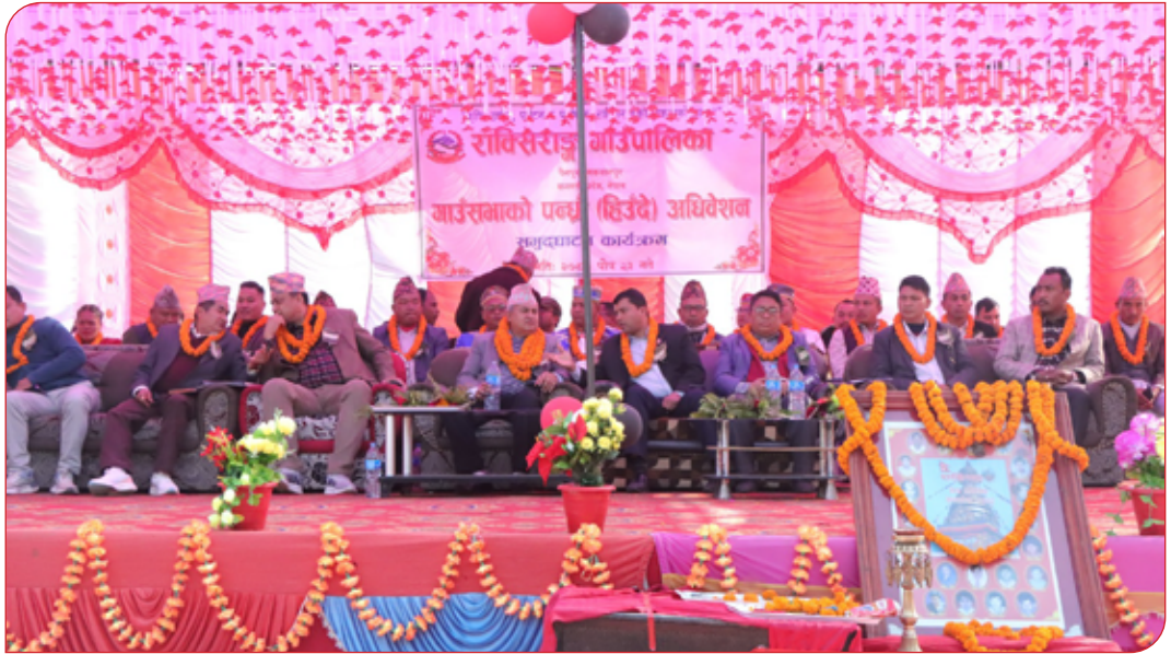
१५औं हिउँदे अधिवेशन