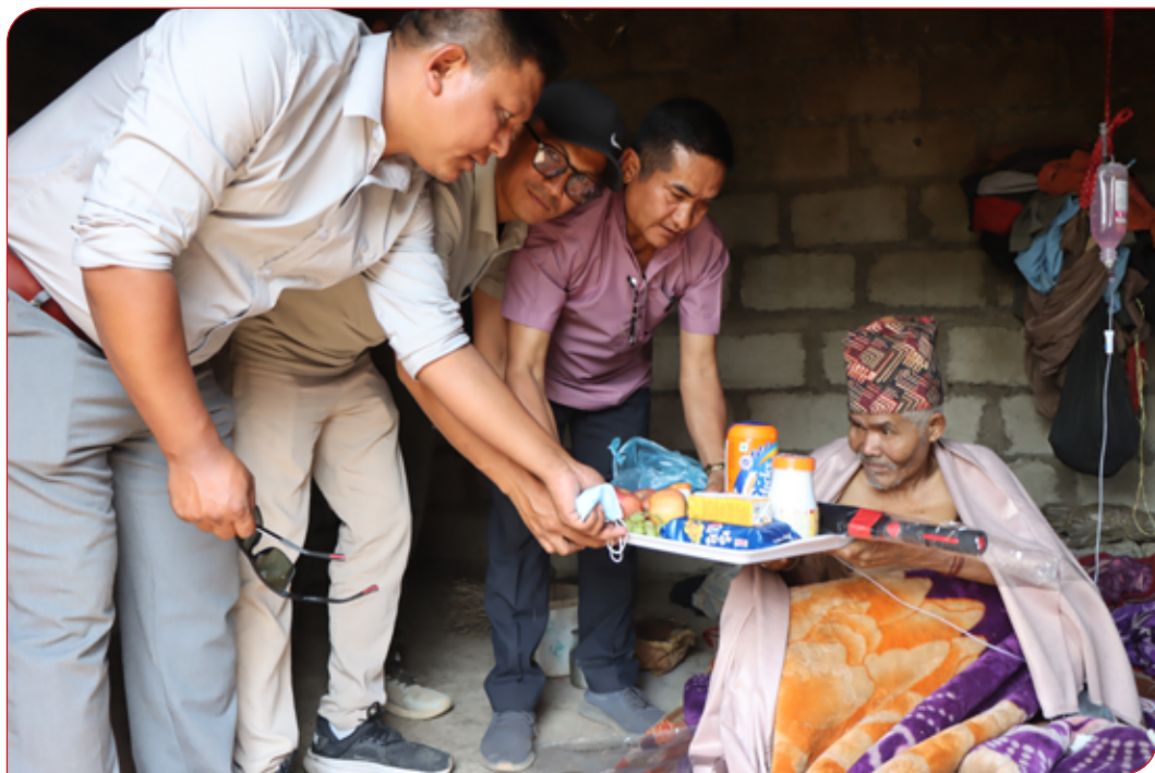
घृन्ति शिविर २०८०-८१