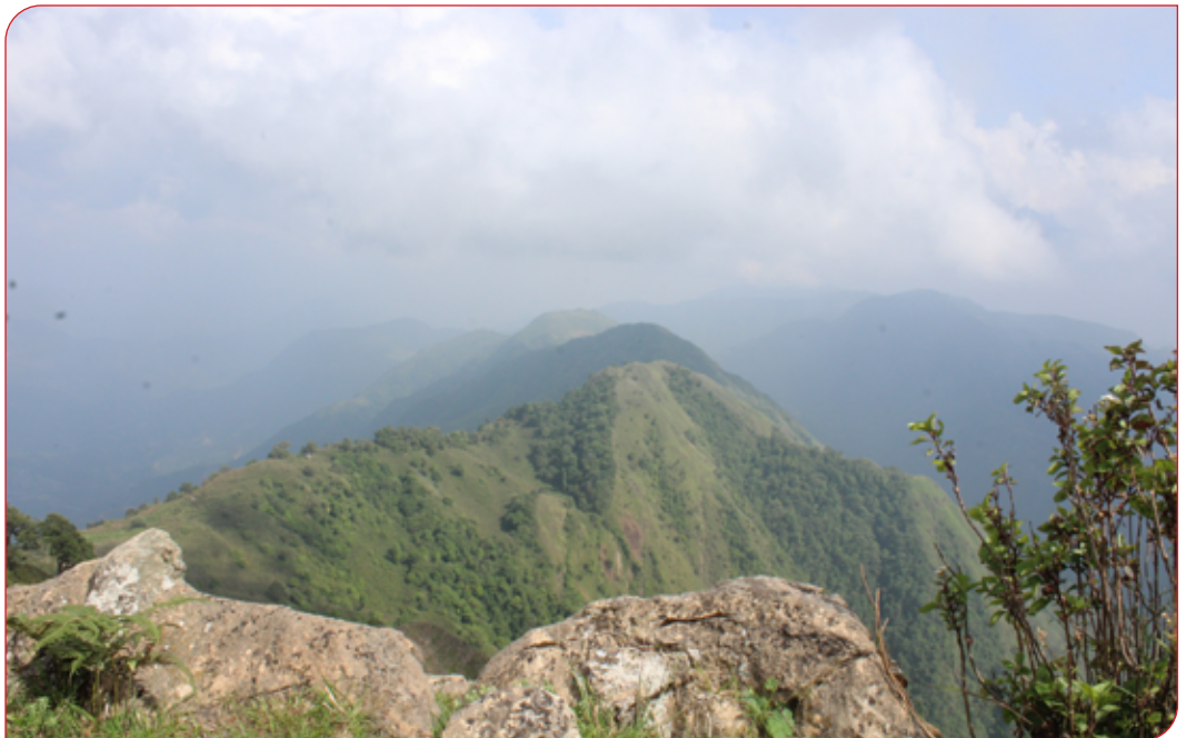
भिम्बुंग पर्यटकीय स्थल