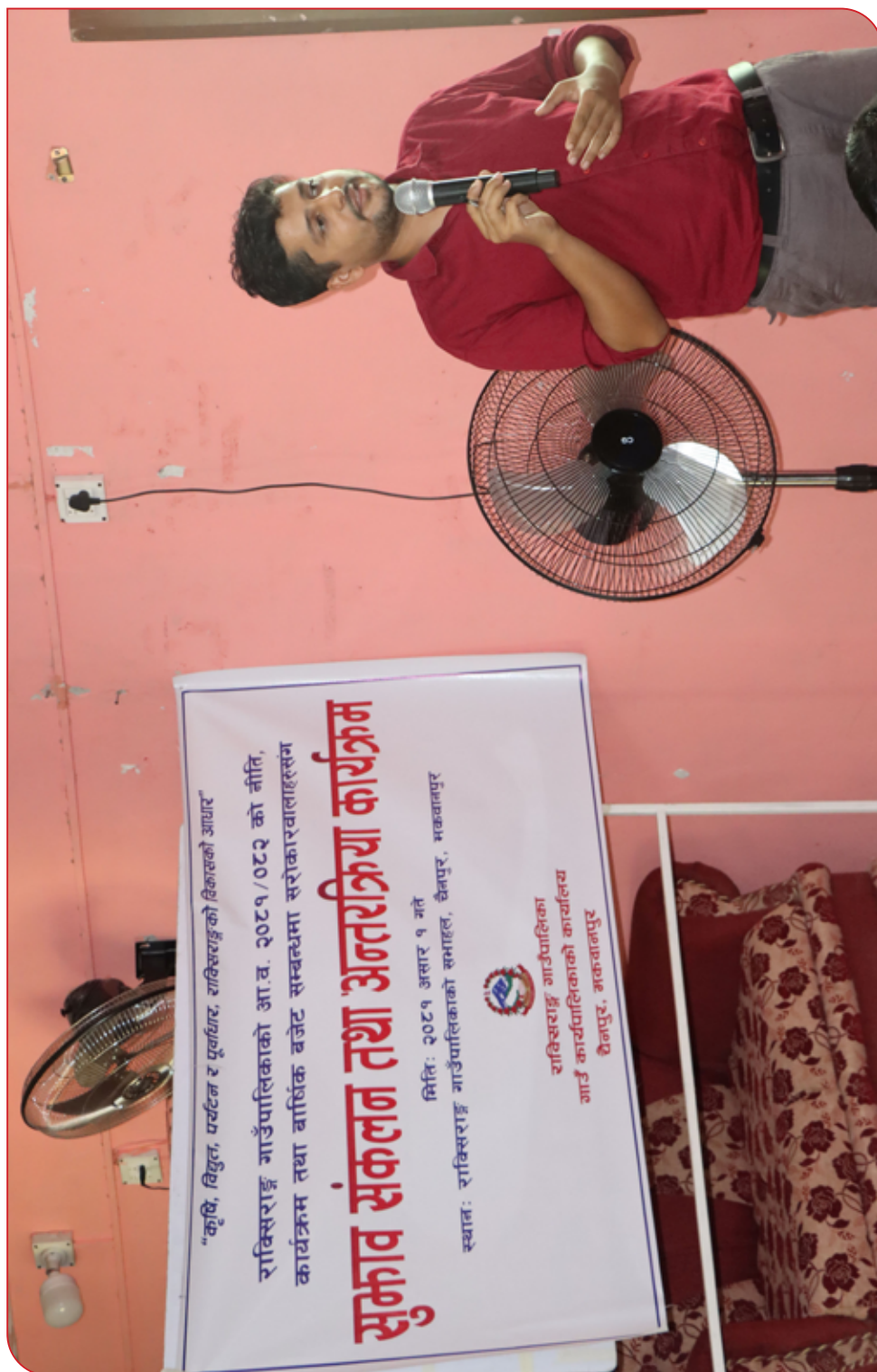
सुम्नाव संकलन कार्यक्रम