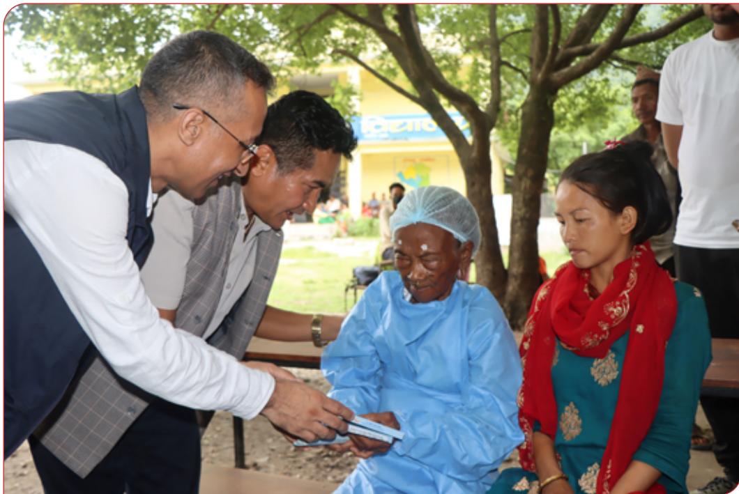
आँखा शिविर शल्यक्रिया कार्यक्रम