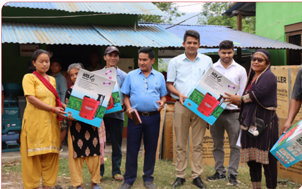
आधुनिक कृषि औजार वितरण कार्यक्रम