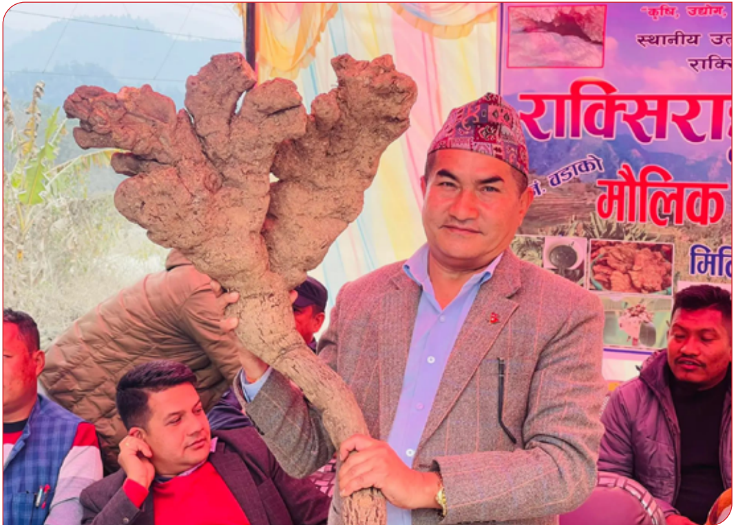
कृषि हाट बजार कार्यक्रम