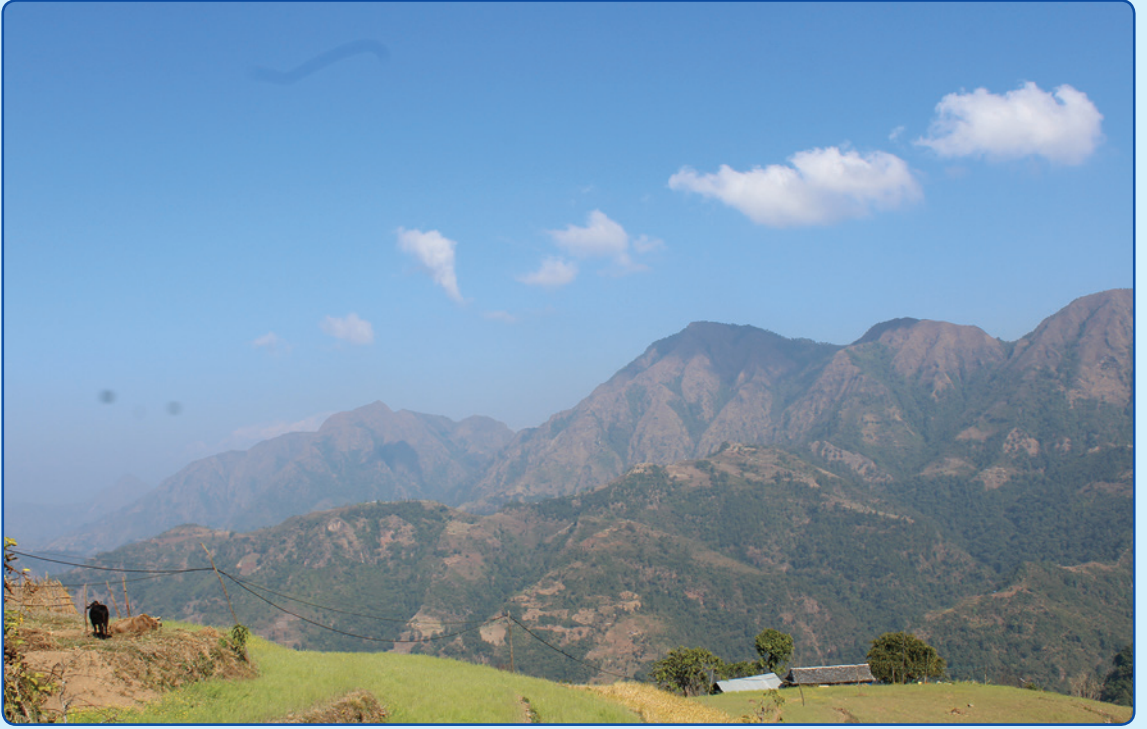
वडा नं. ६ काँकडा