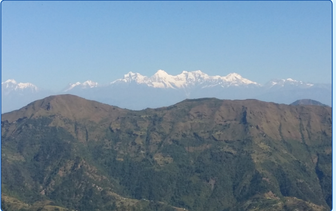
वडा नं. ९ खैराङ्ग बाट गणेश हिमालको दृश्य