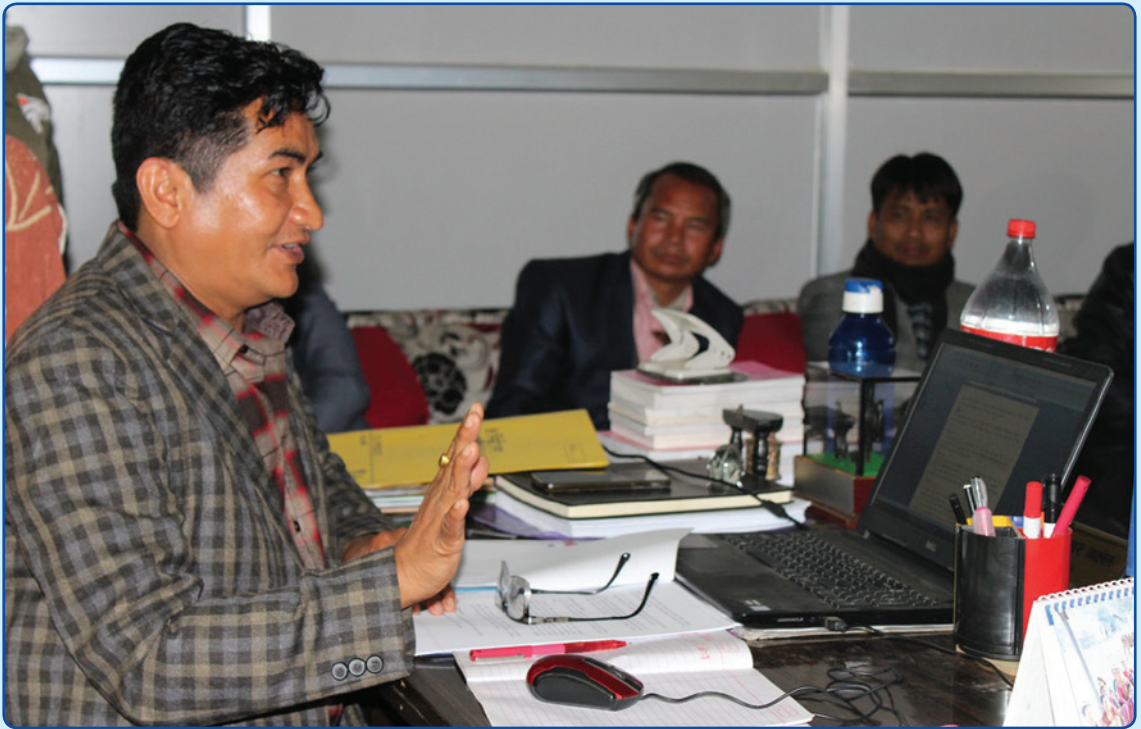
प्रविधिको प्रयोग गर्दै कार्यपालिका बैठकमा अध्यक्ष