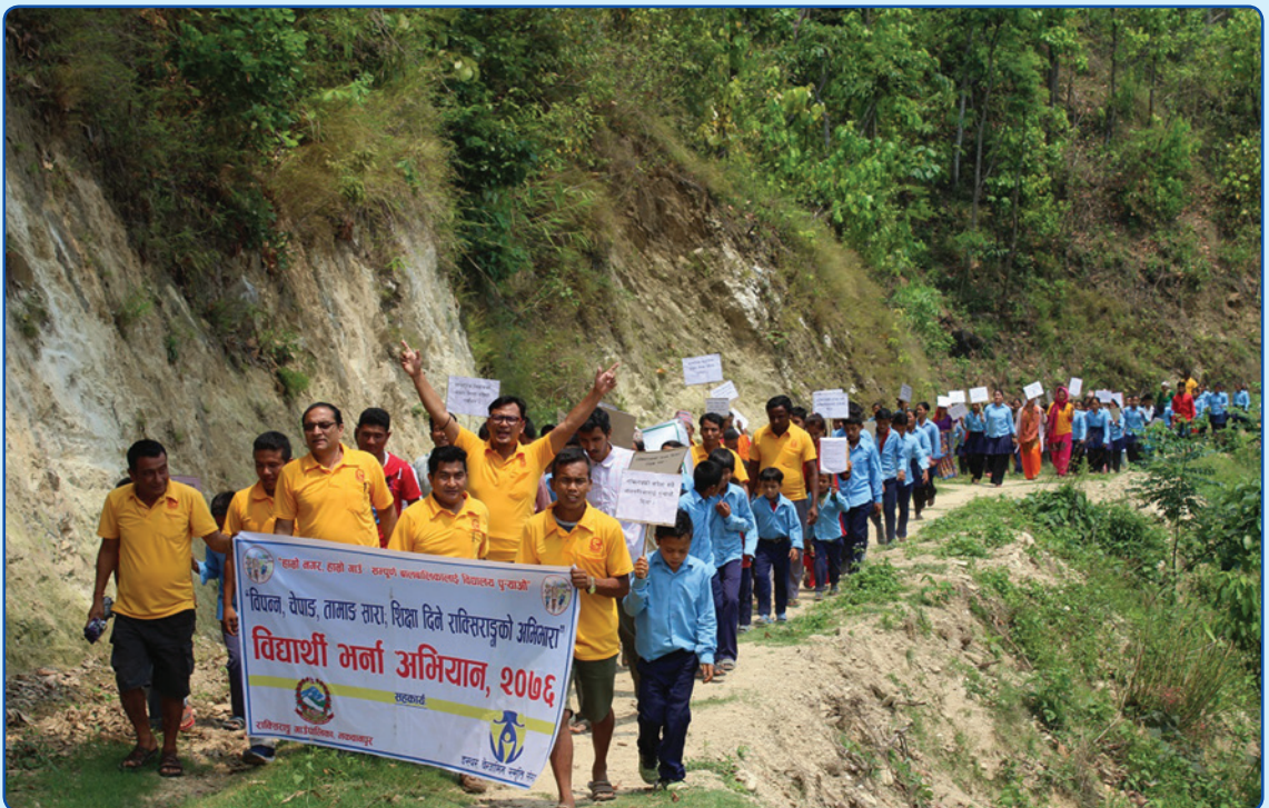
बिद्यार्थी भर्ना अभियान २०७६