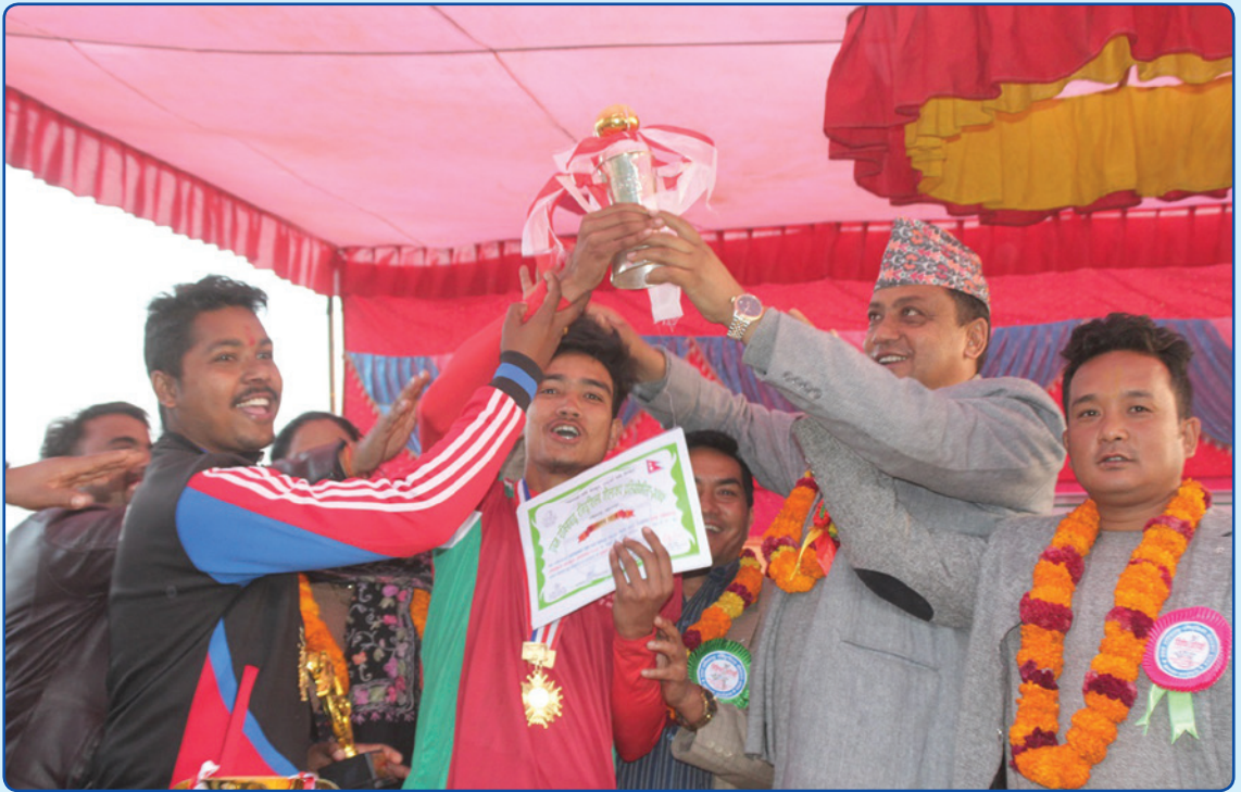
राक्सिराङ्ग गोल्ड कप फुटबल