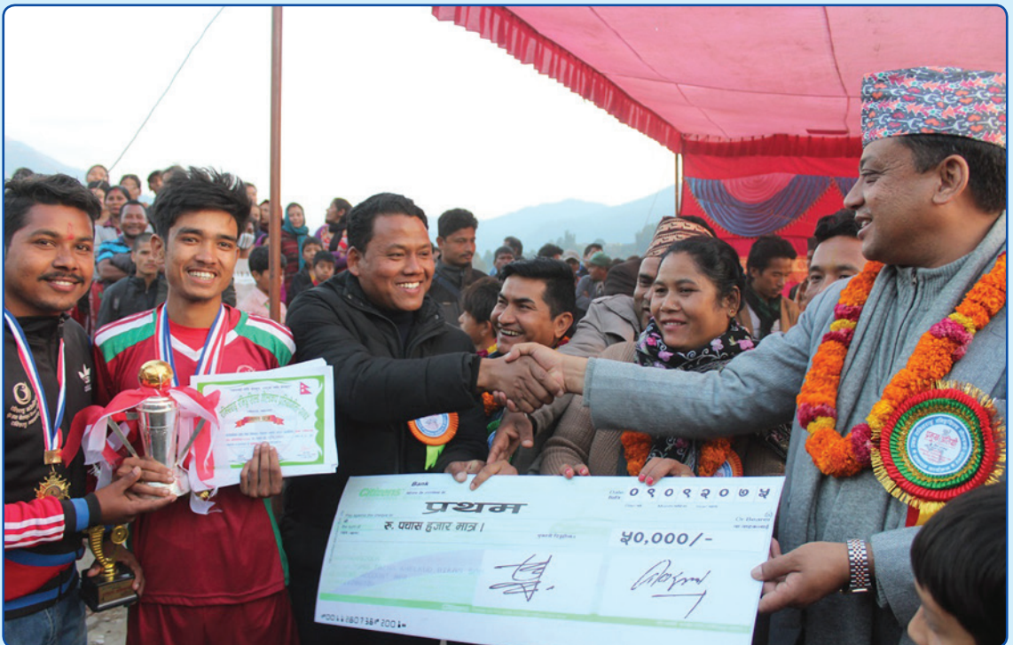
राक्सिराङ्ग गोल्ड कप फुटबल