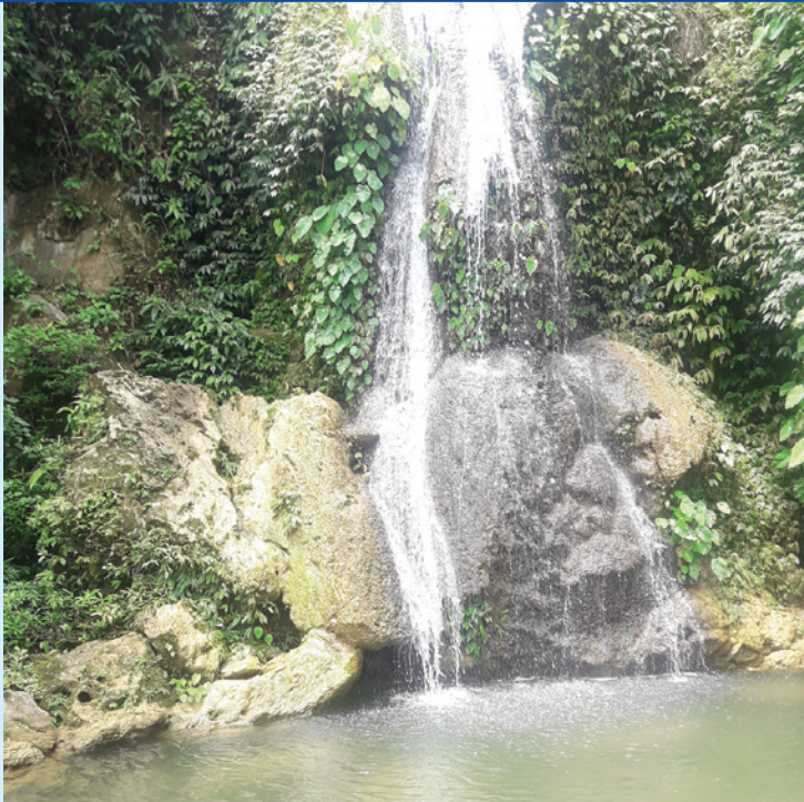
जलपरी भरना, वडा नं. ३ सरिखेत पलासैं