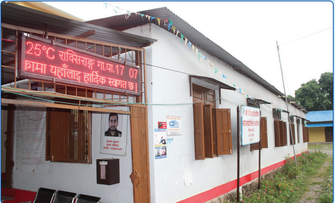
राक्सिराङ्ग गाउँपालिकाको कार्यालय