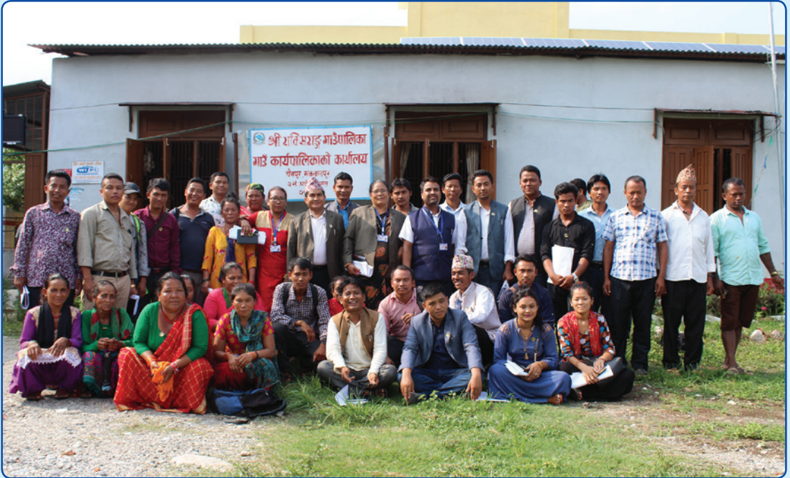
गाउँ सभामा सबै सदस्यहरु