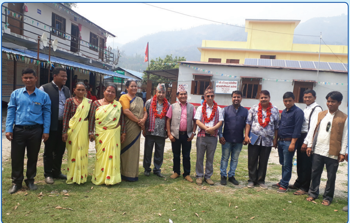
जिल्ला न्यायाधीशबाट गाउँपालिका न्यायिक समितिको अनुगमनको क्रममा