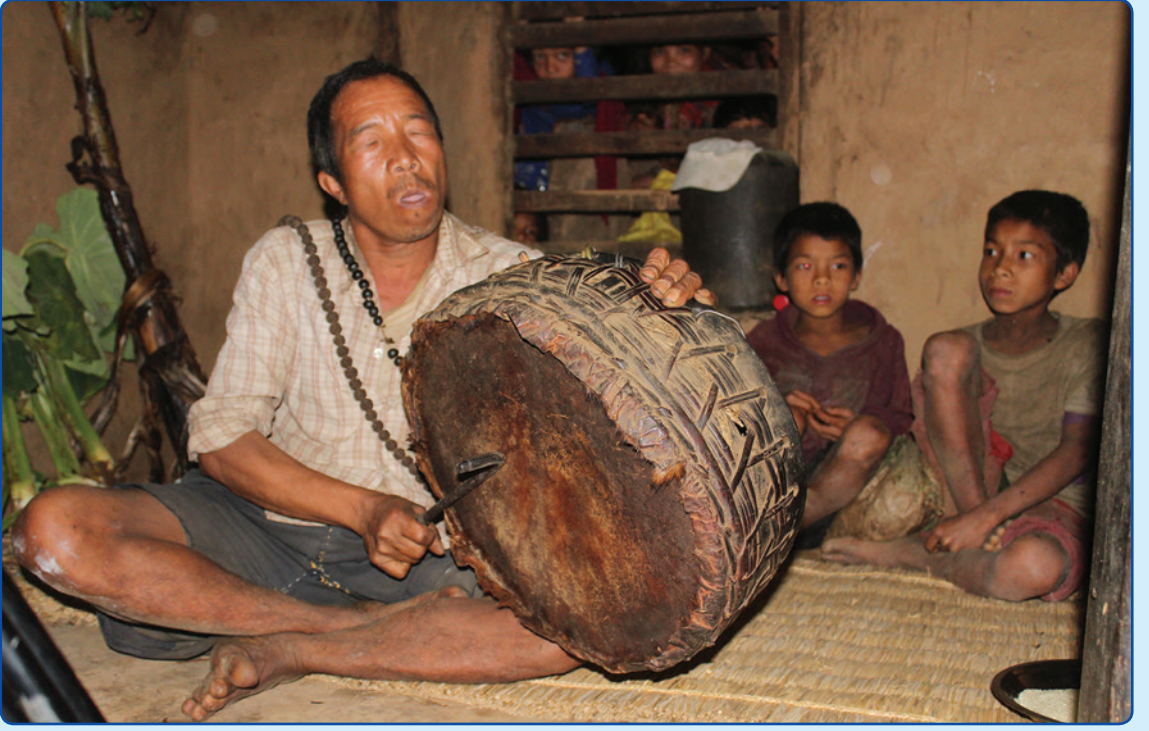
चेपाङ्गरुले न्वागी पर्व मनाउदै