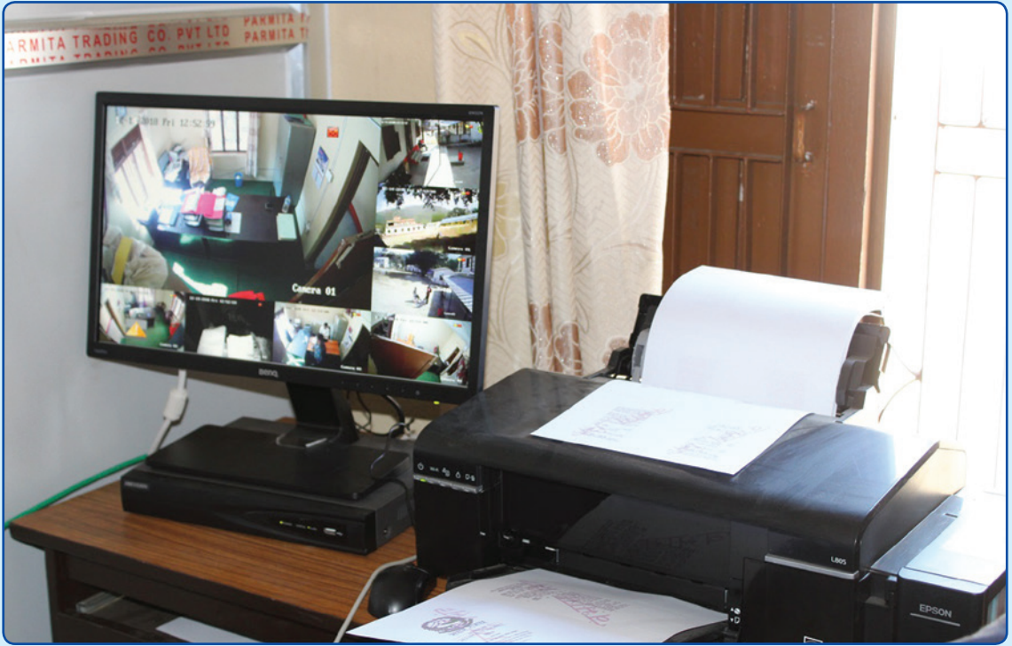
कार्यालय परिसरमा रहेको सिसिटिभी निगरानी, प्र.प्र.अ. बाट