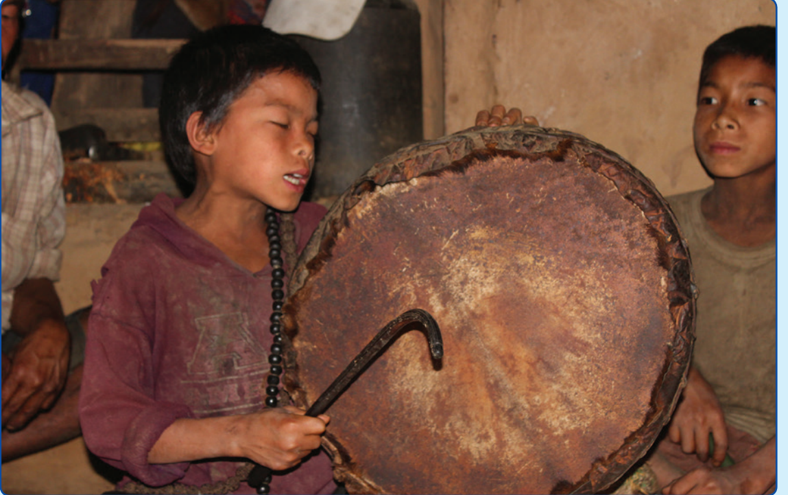
बाल भक्ती, न्वागी पर्वमा