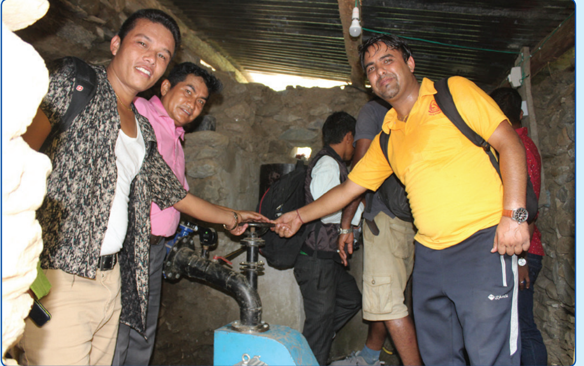
पेल्ट्रिक सेट उद्घाटन वडा नं ७