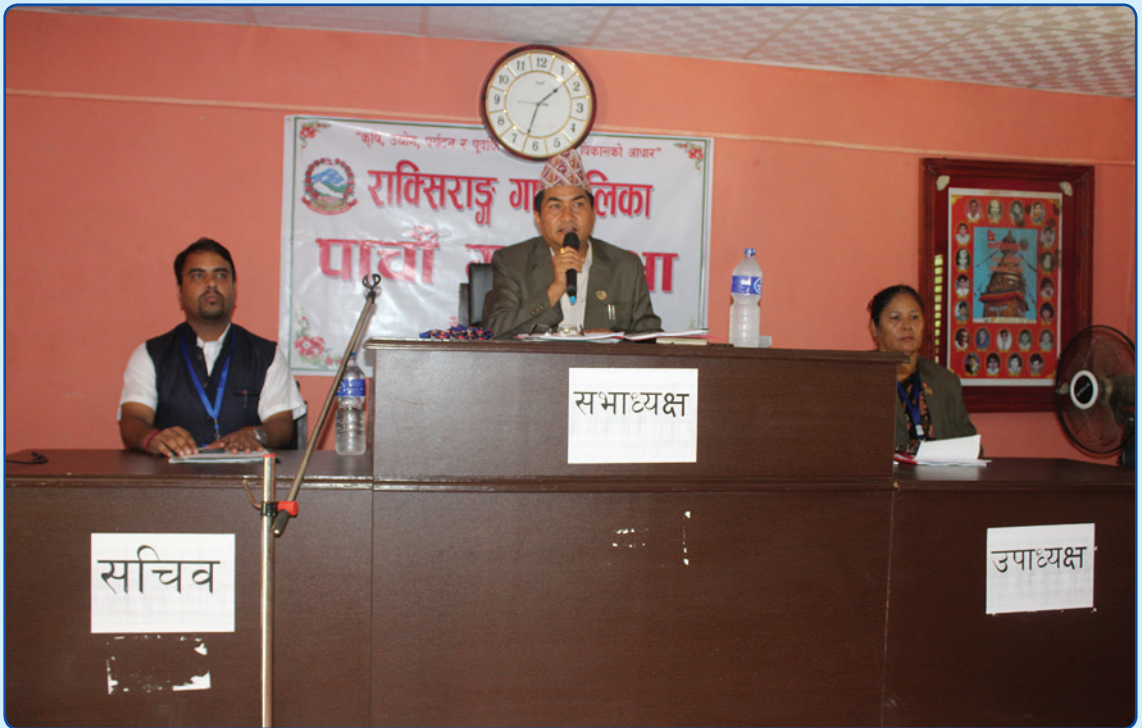
पाचौँ गाउँ सभा २०७६ आषाढ १०