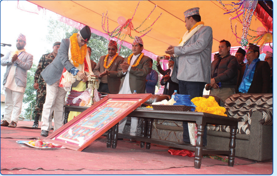
चौथो गाउँ सभा तथा मनहरी चैनपुर सडक उदघाटन २०७५