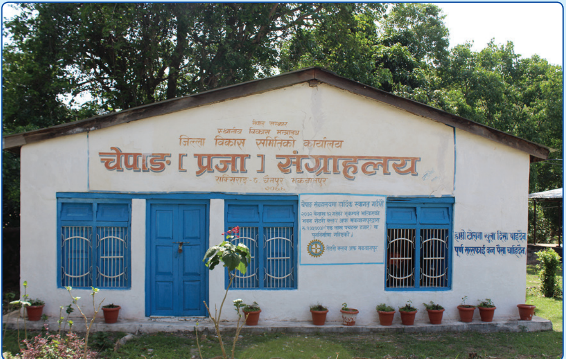
चेपाङ संग्रहालय, चैनपुर