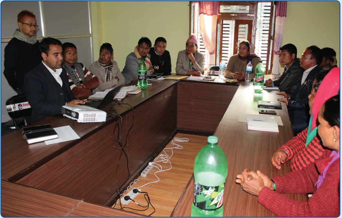
कार्यपालिकाको बैठक चल्दै