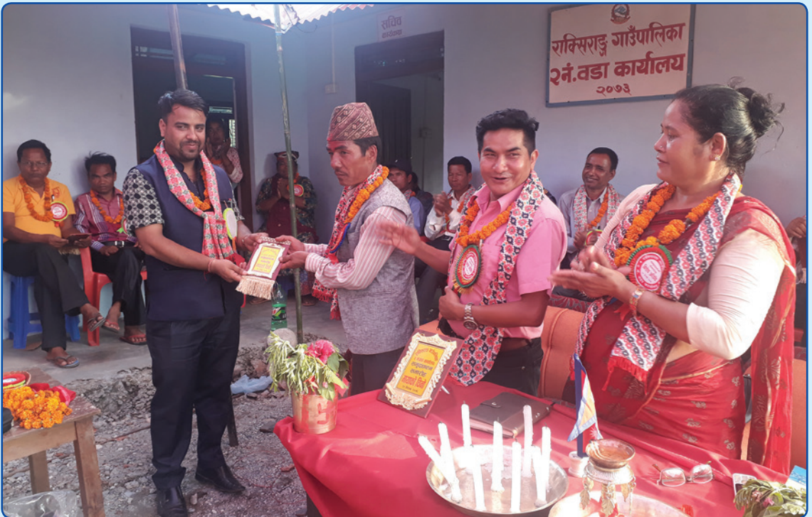
२ नं वडा कार्यालय उद्घाटन