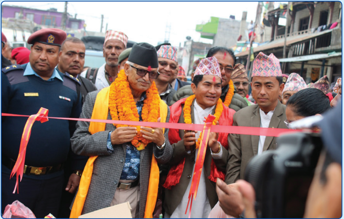
मनहरी चैनपुर सडक उदघाटन २०७५